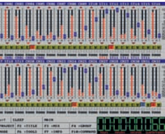
Screenshot der ADT MT-5: Das „C“ unter den Fadern zeigt den Mute-Automations-Status und „W“ steht für Write.