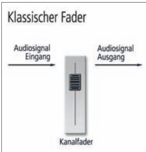
Hier sieht man den Signalfluss eines Audiosignals bei einem klassischen Fader ...

Bei einem VCA (engl. = Voltage Controlled Amplifier) handelt es sich um eine spannungsgeregelte, elektronische Verstärkerschaltung.